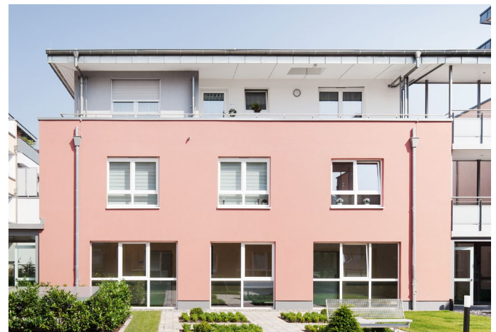
Ein klares Farbkonzept der WDVS-Fassaden strukturiert die facettenreiche Gestaltung der Wohnanlage.

Kalksandstein ist ein zukunftsfähiger und zuverlässiger Baustoff. Beispielsweise beim Thema Energieeffizienz. Durch die Funktionstrennung Wand und Dämmung lassen sich Gebäude an jeden Energiestandard problemlos anpassen. Darüber hinaus vereint Kalksandstein die drei Dimensionen des Nachhaltigkeitsbegriffes Ökonomie, Ökologie und Soziales in sich. Der weiße Wandbaustoff besteht aus den rein natürlichen Rohstoffen Kalk, Sand und Wasser. Abbauflächen werden fachmännisch und mit großer Sorgfalt renaturiert. Weitere Vorteile des Kalksandsteins liegen in seiner hohen Ausführungsqualität und der bauphysikalischen Leistungsfähigkeit. Menschen, die sich mit Kalksandstein-