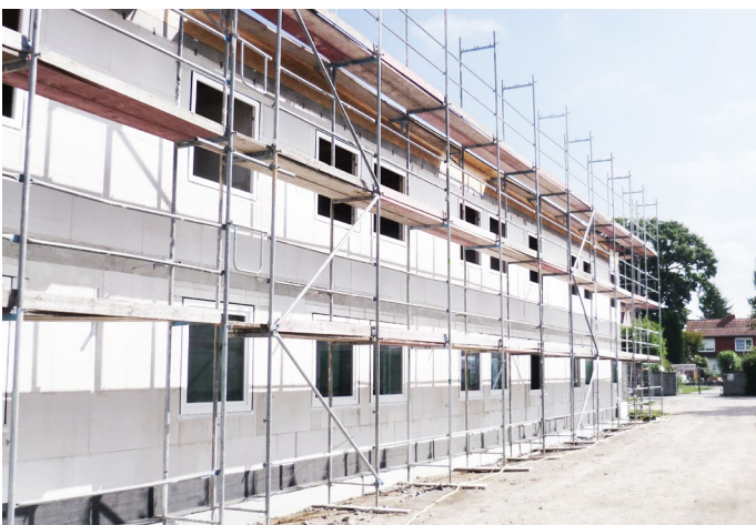
Verkürzung von Bauzeiten durch schnell wachsende Kalksandsteinwände.

Eine Lösungsmöglichkeit, die zur Kompensierung der Kostensteigerung beiträgt, ist die Anpassung der thermischen Gebäudehülle. Mit einer funktionsgetrennten Kalksandstein-Außenwandkonstruktion lässt sich die Optimierung des baulichen Wärme-