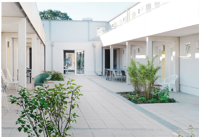
Einzelwohnungen wurden um den Innenhof gegliedert.

schutzes kostengünstig realisieren. Die Dicke der Dämmschicht wird dazu flexibel dem geforderten Wärmedämmniveau angepasst.