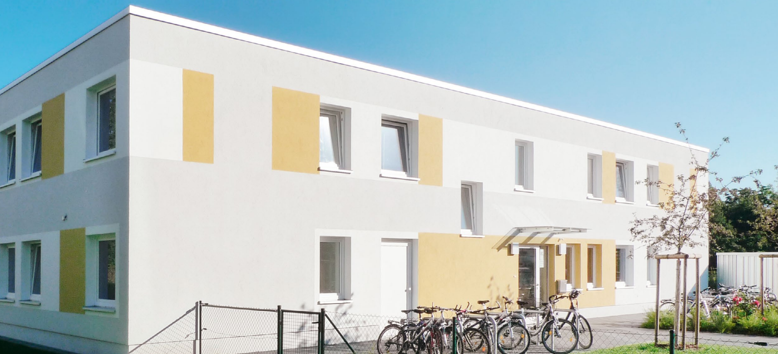
Zweigeschossige Unterkunft mit Nachnutzungsoption: Leichte Modifikationen ermöglichen dauerhaft nutzbaren Wohnraum.

schutzes kostengünstig realisieren. Die Dicke der Dämmschicht wird dazu flexibel dem geforderten Wärmedämmniveau angepasst.