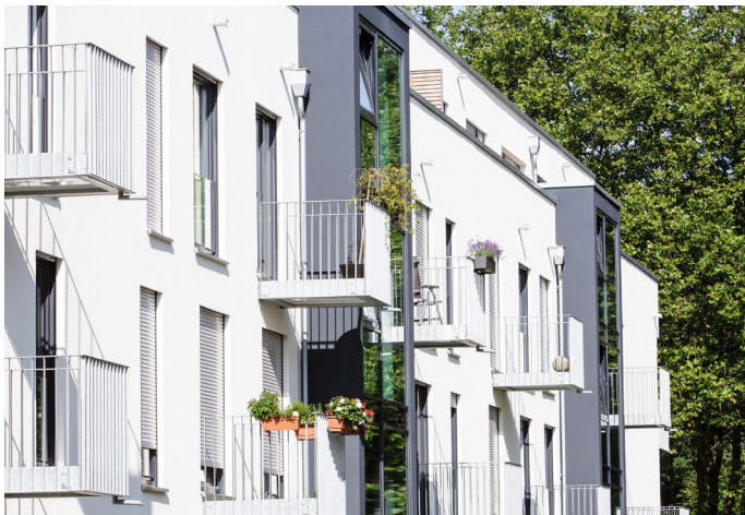
Bezahlbarer Wohnraum und architektonischer Anspruch im Einklang.

Durch vorgefertigte, ausschließlich regional hergestellte Kalksandsteine, reduziert sich die Bauphase massiver, mehrgeschossiger Wohngebäude signifikant. Die einzelnen Werke besitzen durch ihre Regionalität eine hohe Expertise bei lokalen Anforderungen an Massivbauweisen. Dies bedeutet kurze Wege von der Planung über die Lieferung bis hin zur Ausführung. Arbeitsabläufe im gesamten Bauprozess lassen sich logistisch perfekt aufeinander abstimmen. Zusätzlich werden durch die hohe