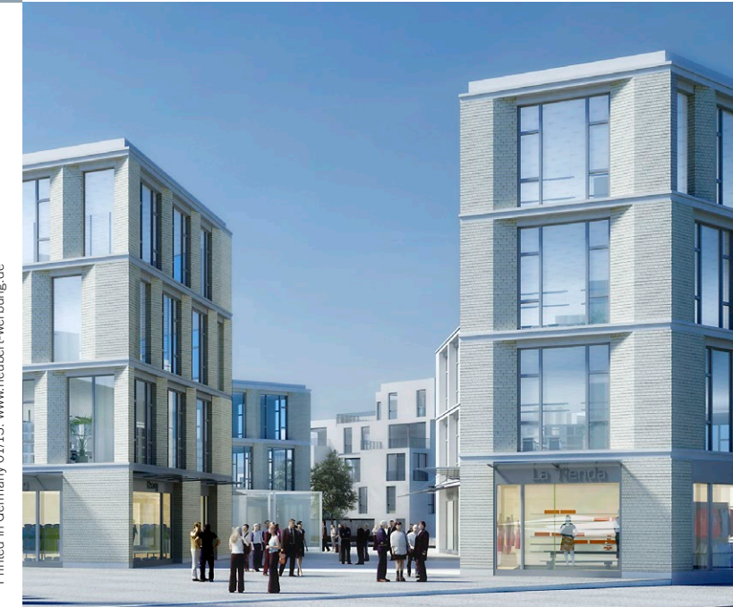
„Quartier Killesberghöhe“, © Ortner & Ortner, Berlin

Landesmesse Stuttgart GmbH. Angaben ohne Gewähr. Änderungen vorbehalten. Printed in Germany 01/13. www.neubert-werbung.de