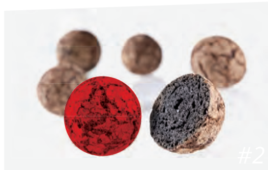
Veredelung des Lias-Ton zu „Liapor“