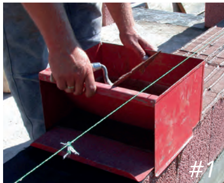
Dünnbettvermörtelung / LIAPLAN®-Mörtelschlitten