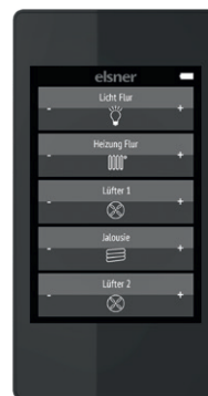
Funk-Fernbedienung Remo pro

Die im Steuerungssystem integrierte Funktechnik bietet Ihnen die Freiheit Ihre Haustechnik auch in Zukunft zu erweitern und an geänderte Bedürfnisse anzupassen. Auch für denkmalgeschützte Gebäude ist die kabellose Technologie ideal.