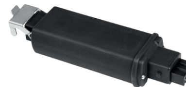
Steckbares F-Con Funk-Modul für einfachen Anschluss zusätzlicher Motoren, Geräte, Leuchten