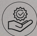
Stabilität und Zuverlässigkeit