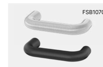
U-Drücker, EN 179 geeignet

PZ-Rosette zum Compact-Schild Edelstahl und Schwarz