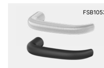
Ulmer Klinke, EN 179 geeignet