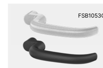
Ulmer Klinke, gekröpft, EN 179 geeignet