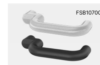
U-Drücker, gekröpft, EN 179 geeignet